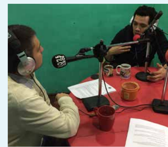
Radio Graneros 107.5 FM