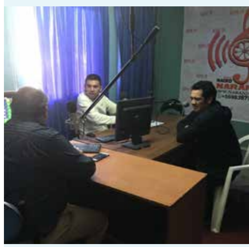
Radio Naranja 104.9 FM