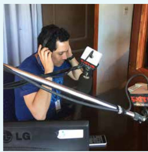
Radio Éxitos 106.1 FM