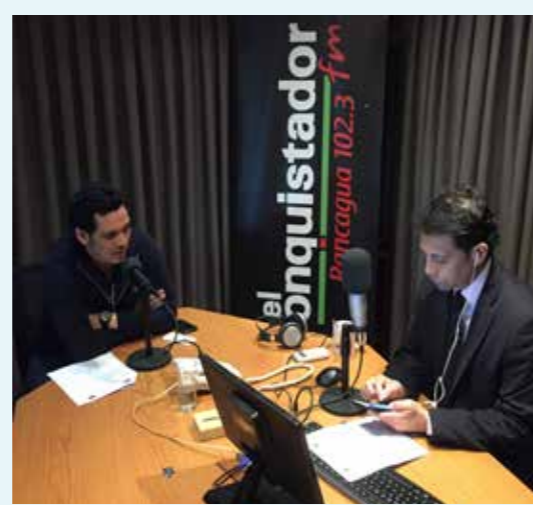
Radio El Conquistador 102.3 FM